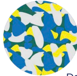
Detalle de textura