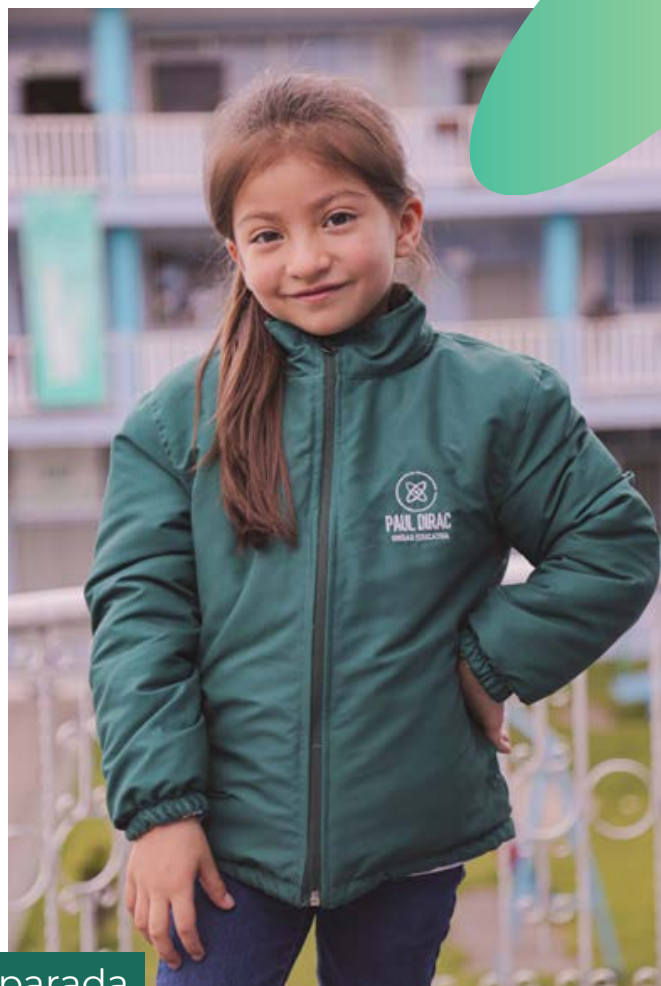
Uso de parada